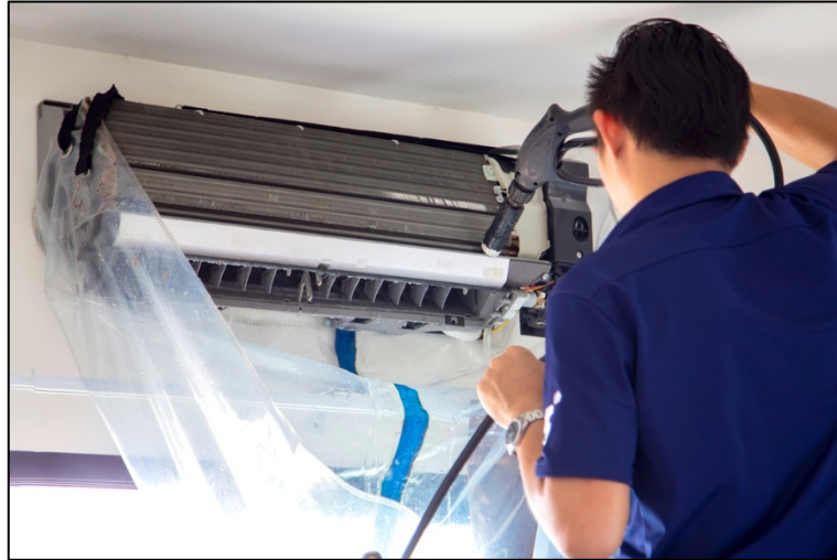
圖 1 空氣調節機清洗示意圖