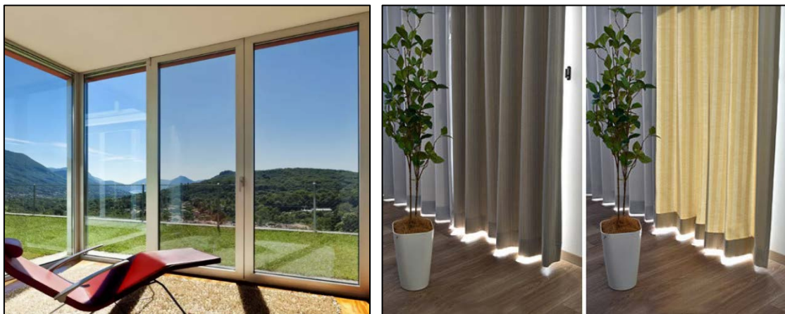
圖 2 隔熱膜及隔熱窗簾示意圖

合計 1+2 項補助上限每戶 5,000 元(旅館及民宿業者不在此限)，書面審核並進行(抽)查核作業。