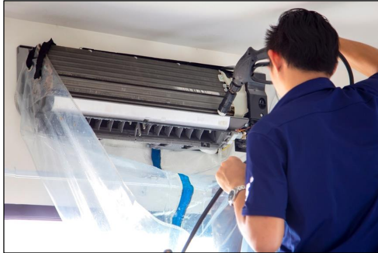
圖 1 空氣調節機清洗示意圖